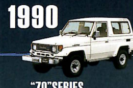
1990 "70" SERIES 高出力ディーゼルエンジンを搭載。 セミロングホイールの4ドアバンが追加。 機能性・快適性も進化。