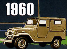
1960 "40" SERIES 高速走行の快適さも求める 北米のニーズを重視して設計。 以降、24年間にわたり 販売されたロングセラーモデル。