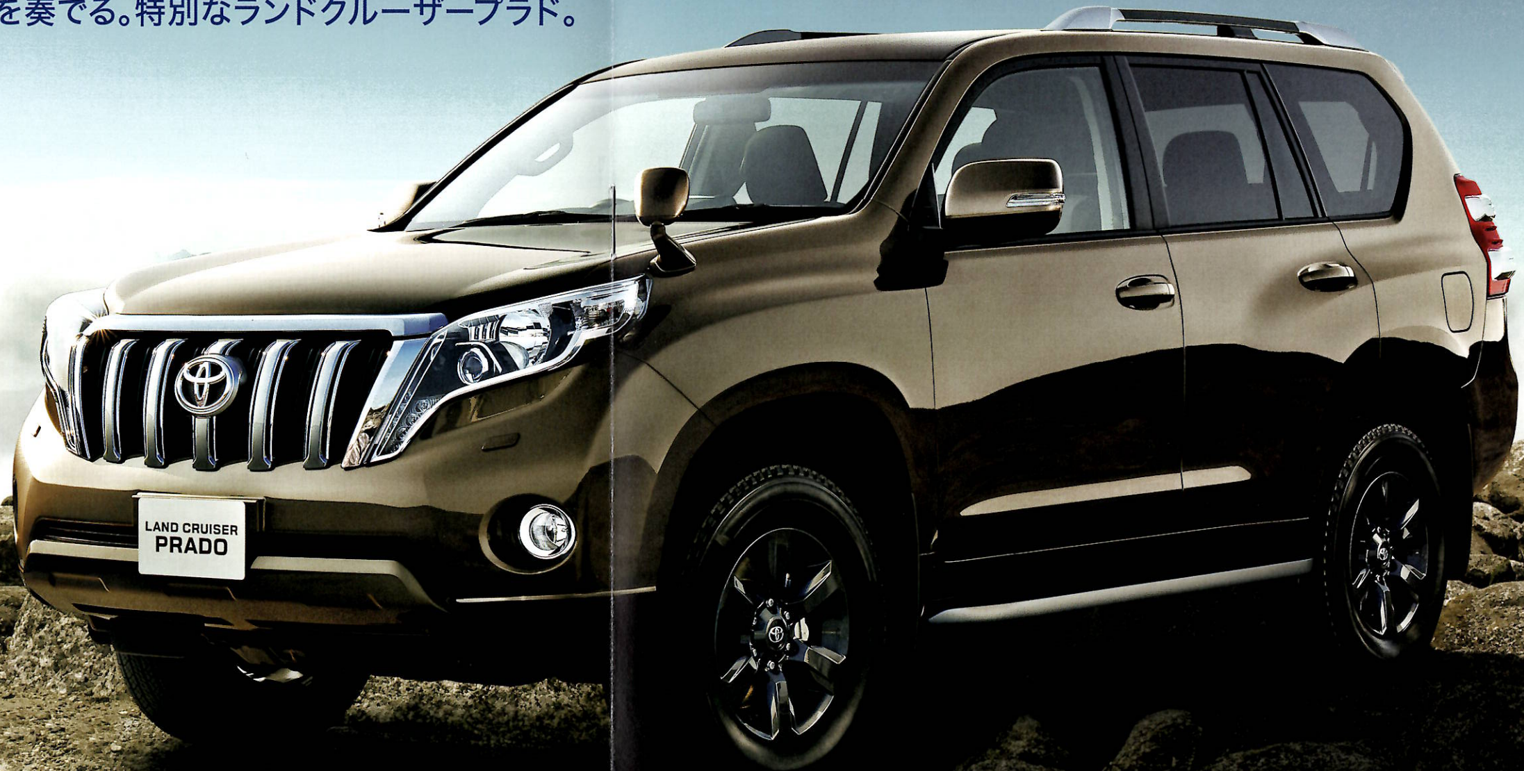
Photo: ランドクルーザープラド特別仕様車TX"Argento Cross"<7人乗り> (ベース車両はTX<7人乗り>)。ボディカラーはブロンズマイカメタリック (4T3)。LEDヘッドランプはメーカーオプション。