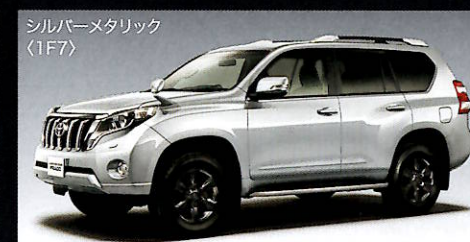
シルバーメタリック (1F7)