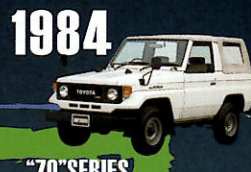
1984 "70" SERIES 本格的なアウトドアブームの到来を 見据えて開発に着手。 ヘビーデューティの新たな出発点。