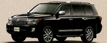
Photo:ランドクルーザー特別仕様車ZX“Bruno Cross” (ベース車両はZX)。ボディカラーはブラック(202)。HDDナビゲーションシステム&トヨタプレミアムサウンドシステム、マルチディスプレイモニターはメーカーオプション。 ※マルチディスプレイモニター非選択の場合、左フロントフェンダー上部に補助確認装置(2面鏡式)が装着されます。

*1.沖縄地区は価格が異なります。 *2.北海道地区の価格には寒冷地仕様が含まれます。