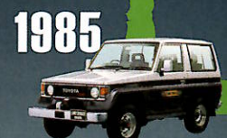
1985 "70" SERIES (WAGON) もっと気軽に4駆を操りたいユーザー のために、70系から派生。 ライトデューティの系譜が生まれる。