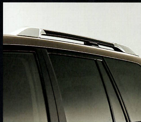
●専用2トーンルーフレール [シルバー×ブラック]