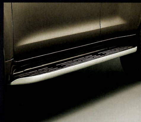
●カバー付サイドステップ [シルバー塗装]