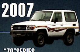
2007 "70" SERIES フロントまわりのデザインを変更し、 V8ディーゼルエンジンを搭載。 海外向けとしては初めて4ドアバンが 設定される。