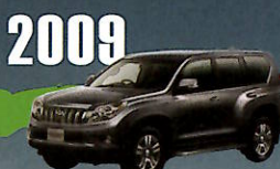
2009 LAND CRUISER PRADO "150" SERIES よりモダンで流れるようなボディフォルム へと進化。200系をも凌ぐほどの ハイテクデバイスを多数搭載。