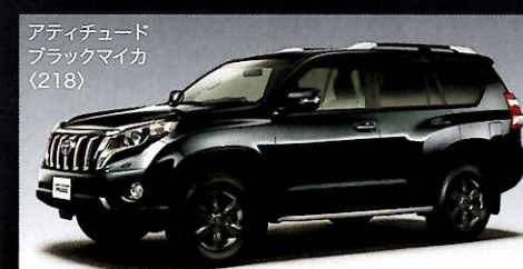
オーディオチュード ブラックマイカ (218)