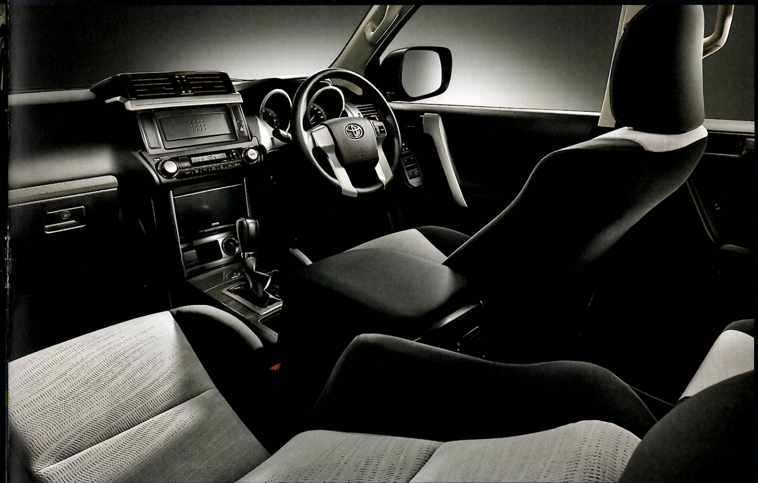
Photo:ランドクルーザーブラド特別仕様車TX“Argento Cross” <7人乗り> (ベース車両はTX<7人乗り>)。内装色はブラック。LEDヘッドランプ<124,200円>はメーカーオプション。 ■写真の計器盤は機能説明のために各ランプを点灯させたものです。実際の走行状態を示すものではありません。