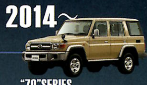
2014 "70" SERIES 海外で専用モデルとなっていた70系が 誕生30周年を記念し、 期間限定日本復活。