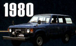
1980 "60" SERIES ラグジュアリーなスタイルを極めた 60系は、パブル景気に賑わう時代の ステイタスシンボルとなった。