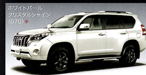
ホワイトパール クリスタルシャイン (070)*