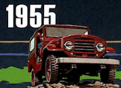
1955 LAND CRUISER "20" SERIES "ランドクルーザー"の名が、 はじめて掲げられる。