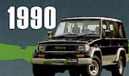
1990 LAND CRUISER PRADO "70" SERIES フロントまわりのデザインを一新。 正式に「ランドクルーザープラド」と 命名される。