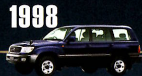
1998 "100" SERIES 最も信頼できるSUVとして世界で 認められたシリーズ。本当に優れたもの を選ぶ厳しい目に応えている。