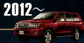
2012~ "200" SERIES 卓越のオフロード性能と ラグジュアリーな世界を両立した 史上最強の4WDとして進化。