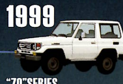
1999 "70" SERIES フロントサスペンションに コイルスプリングを採用。 国内の販売は2004年で終了。