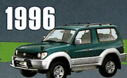
1996 LAND CRUISER PRADO "90" SERIES 70系の派生モデルだったプラドが、 エンジンからフレーム、サスペンション までを専用化し、完成度を高めた。