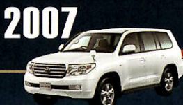
2007 "200" SERIES 100系の prestige 性を さらに高めたモデルとして200系が誕生。 圧倒的な走破性と快適性を手に入れた。