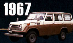
1967 "55" SERIES 北米を中心とした 4駆のレジャー用途に対応。 ランドクルーザーのステーションワゴンの 系譜がここに始まる。