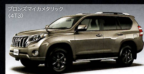
ブロンズマイカメタリック (4T3)

*ボディカラーのホワイトパールクリスタルシャイン(070)<32,400円(消費税抜き30,000円)>はメーカーオプションとなります。 ※写真はメーカーオプションのLEDヘッドランプ装着車です。 ■価格はメーカー希望小売価格(消費税8%込み)14年8月現在のもの>で参考価格です。価格は販売店が独自に定めていますので、詳しくは各販売店におたずねください。 ■ボディカラーは撮影、印刷インキの関係で実際の色とは異なって見えることがあります。