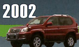
2002 LAND CRUISER PRADO "120" SERIES オンロードでもオフロードでも 扱いやすい4駆として、 多くのユーザーに受け入れられる。