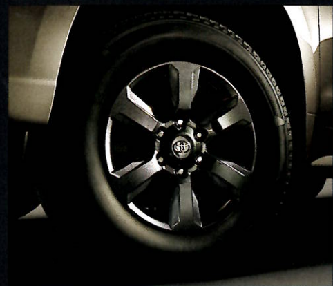
●265/65R17タイヤ+17x7.5Jアルミホイール [専用ダークグレーメタリック塗装]