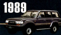
1989 "80" SERIES デザイン・装備ともにラグジュアリー 路線を追求。高級サルーンを思わせる 優雅さをまとった。