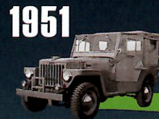
1951 TOYOTA JEEP BJ SERIES 警察予備隊からの要請で開発された "ランドクルーザー"の原点。 タフに走る、ヘビーデューティの 出発点。

2014年に30周年を迎える ランドクルーザー"70"シリーズを記念し、特別仕様車が登場。 とどまることなき進化は、さらなる高みへと到達した。