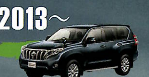
2013~ LAND CRUISER PRADO "150" SERIES ハイテクデバイスがさらに進化。 悪路をものもしない快適な走破性を、 最先端テクノロジーが生み出した。