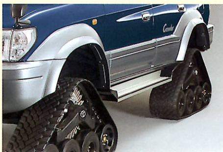
ビッグオーバーフェンダー

クローラーユニットに対応したビッグオーバーフェンダーやプロテクター、メーターの速度表示を補正するスピードメーター切替スイッチなどを標準装備しています。