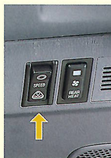
スピードメーター切替スイッチ