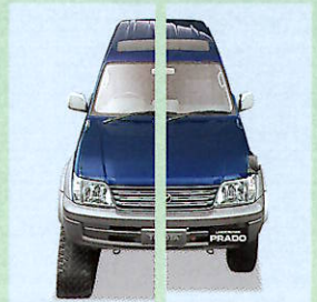
左:クローラーユニット装着時 右:タイヤ装着時