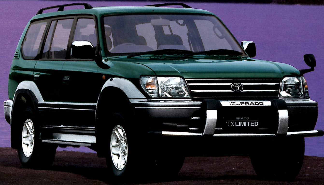
PHOTO:特別仕様車TX Limited (ベース車両はTX 2700カソリン ホテーカーは、ターククリンマイカメタリック<K12> フロントバンパーガード、チルト&スライド電動式ムーンルーフ、フィードモニターは、メーカーオプション

落ち着いたカラーリングと、 ひとクラス上の装備品。 特別なTXは、 大人の遊び心を知っている。