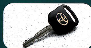
●ワイヤレスドアロックリモートコントロール