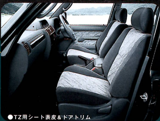
●TZ用シート表皮&ドアトリム

PHOTO:特別仕様車TX Limited (ベース車両はTX 2700カソリン ホテーカーは、ターククリンマイカメタリック<K12> フロントバンパーガード、チルト&スライド電動式ムーンルーフ、フィードモニターは、メーカーオプション