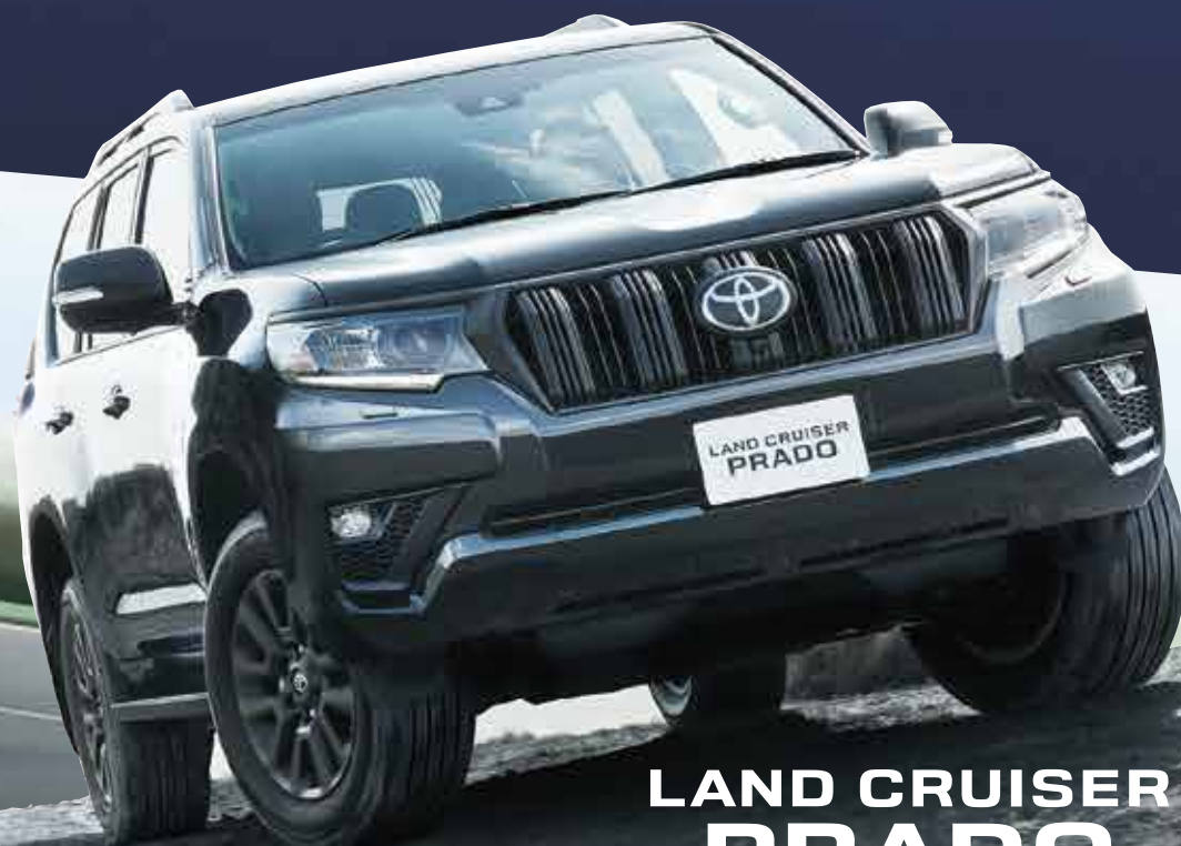
Photo: [メーカーオプション] ボディカラーのブラックマイカメタリックホワイトパールは77,000円高。トヨタチームメイト(フロント) パークは77,000円高。自動防眩インテリジェントハイビーム付は53,900円高。ステアリングセンター シームレスオーディオはセットで38,600円高。